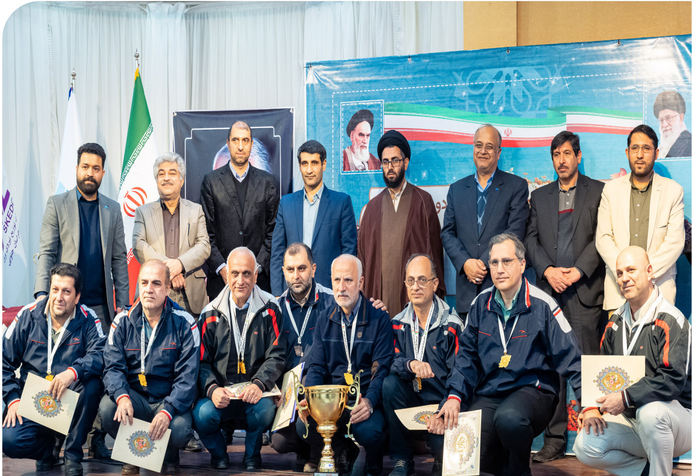
در مراسم اختتامیه بیستمین دوره مسابقات شطرنج برادران وزارت نیرو عنوان شد!