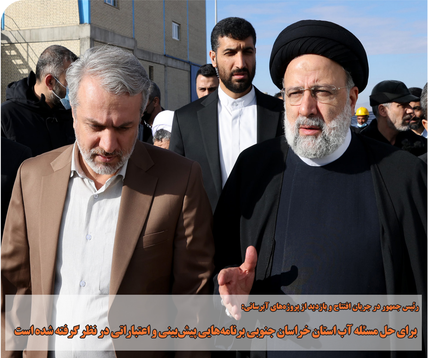
رئیس جمهور در جریان افتتاح و بازدید از پروژه های آبرسانی: